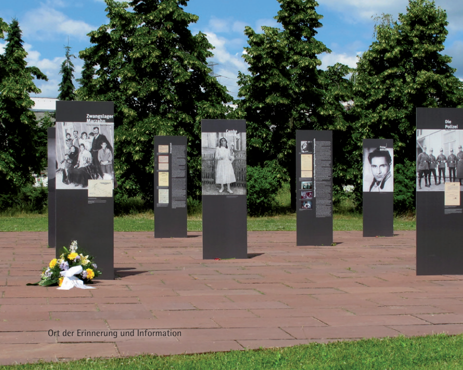
Ort der Erinnerung und Information